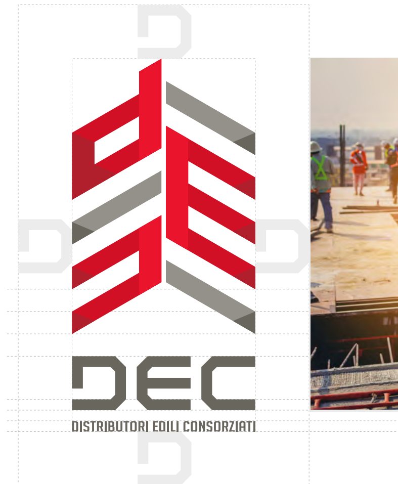
LOGO UFFICIALE verticale

Quando è in rapporto con altri marchi, un'area di rispetto (non visibile) mantiene le distanze corrette per la sua (e altrui) leggibilità.